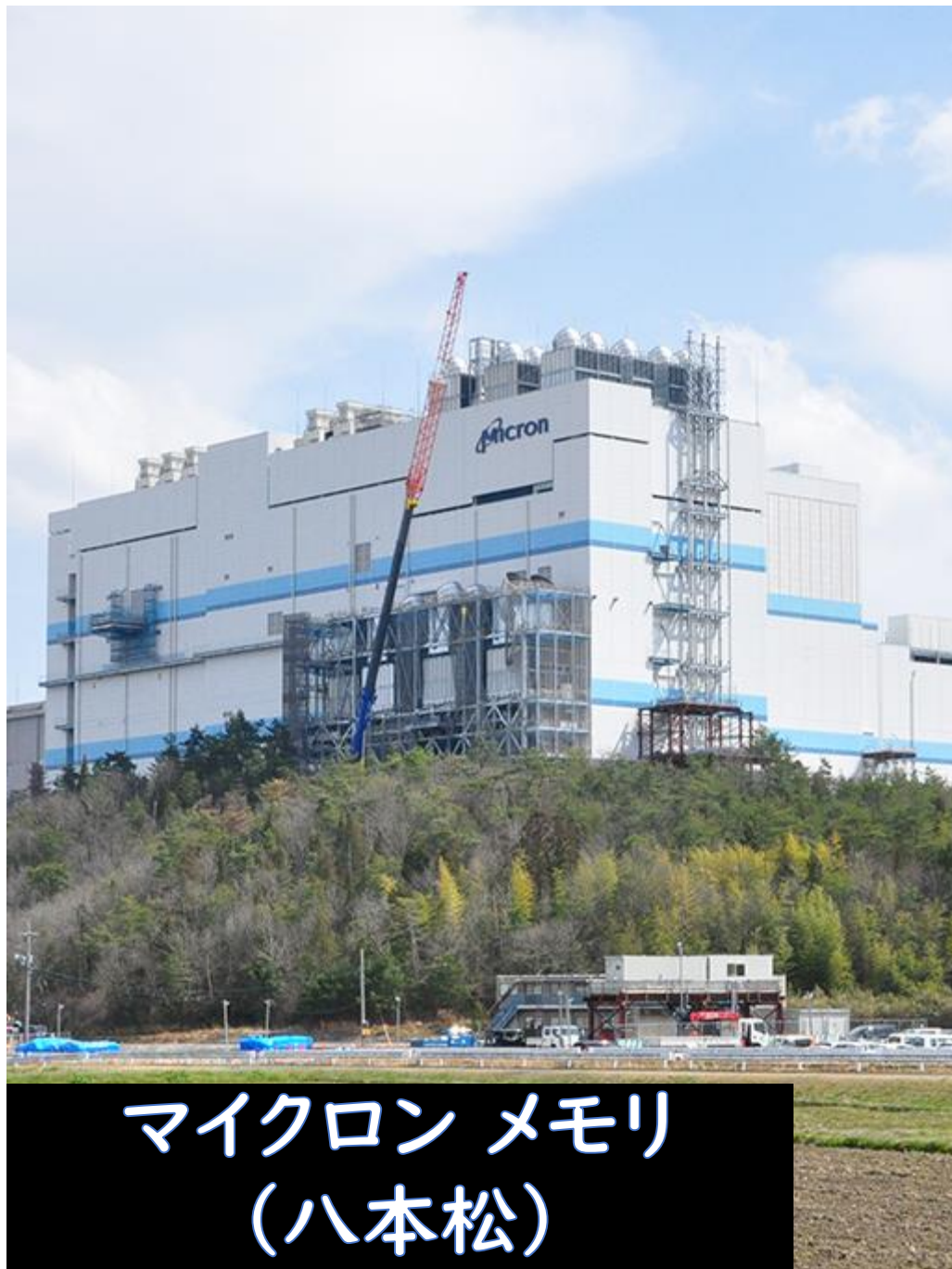
マイクロンメモリ (八本松)