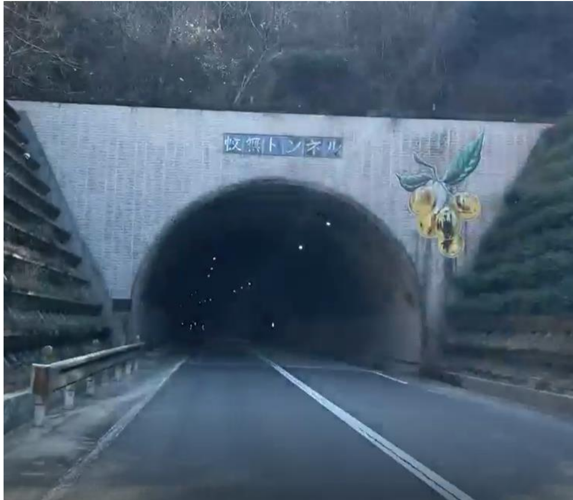
かなしトンネル (安芸津と西条の間)