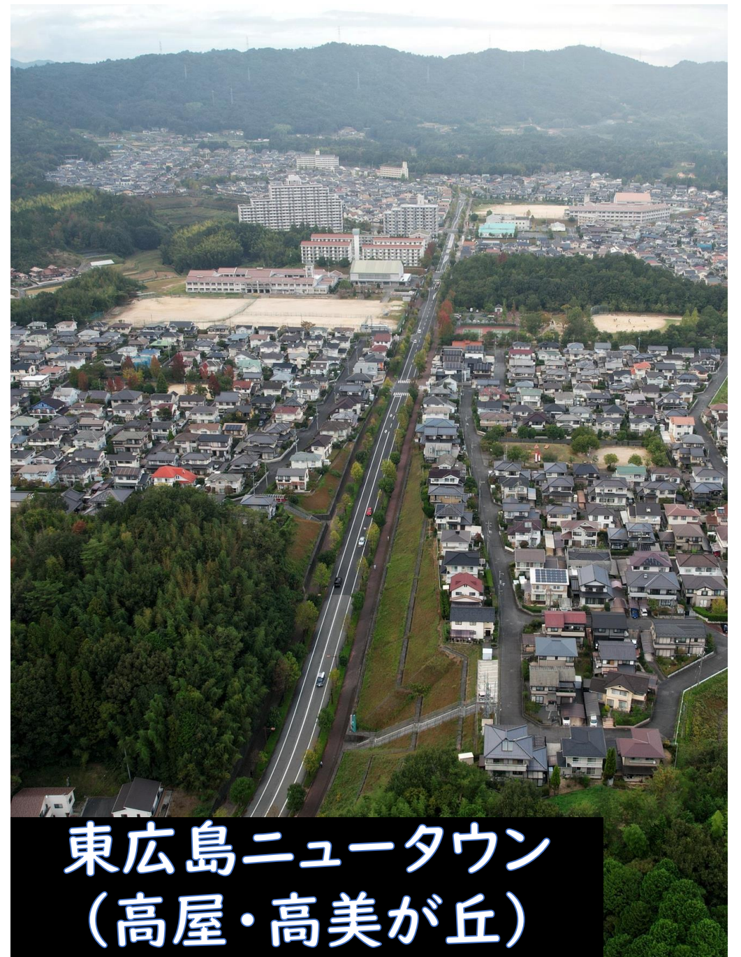
東広島ニュータウン (高屋・高美が丘)